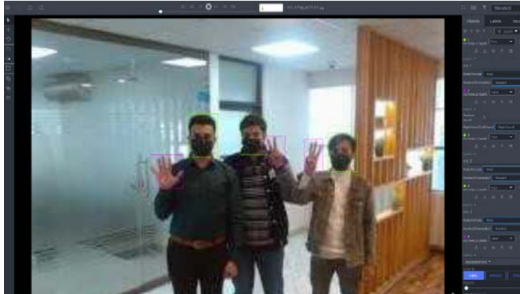
[blackolive 데이터 가공 예시]

테스트웍스는 대량의 데이터 수집이 가능한 클라우드-소싱 기반의 플랫폼 'aiworks'와 데이터 가공부터 검수까지 원스톱 진행이 가능한 'blackolive'를 보유하고 있어 대규모 데이터 수집부터 자동화, 검수 및 관리까지 전 과정에서 효율적인 진행이 가능합니다.