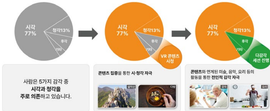
[오감 모두를 충족시키는 솔루션 'SENTENTS']

특히, 'AizWIN'은 기술의 우수성을 인정받아 'CES 2023' 혁신상을 수상하기도 했습니다.