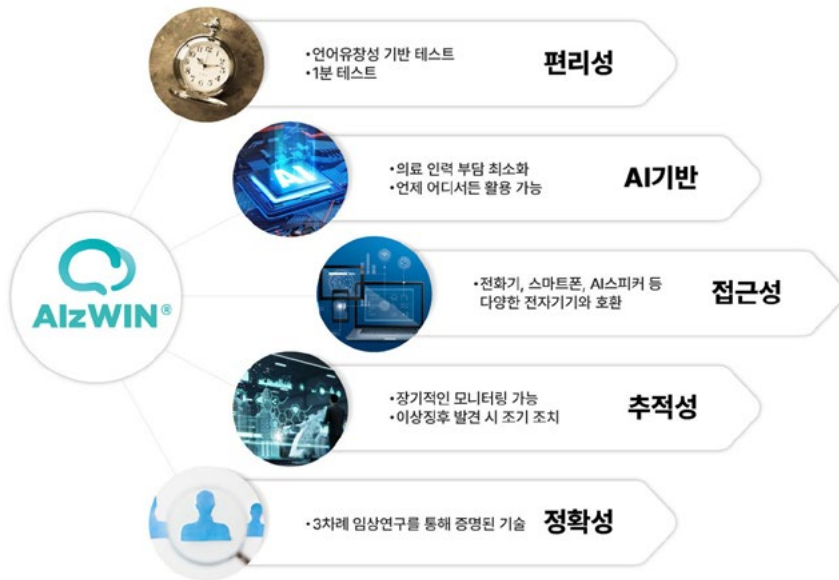
[1분 안에 간단하고 쉽게 뇌건강을 체크하고 모니터 할 수 있는 솔루션 'AizWIN']

세브포인트원은 AI를 활용해 간단한 대화만으로 뇌의 인지 기능 저하 여부를 판별해 2분 만에 치매 고위험군을 선별하는 인공지능 솔루션 'AizWIN'과 VR 기술 기반으로 뇌의 활동성을 높이는 회상 요법 솔루션인 'SENTENTS'를 개발했습니다.