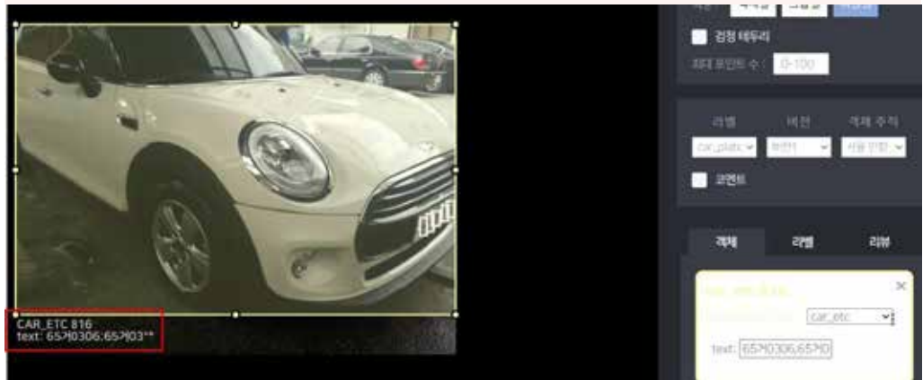
부족한 정보에 대한 추가 가이드라인을 통해 목표 객체 확보

테스트웍스는 주어진 여건 하에서 상황을 해결하기 위해 팀와이퍼와 지속적으로 협의를 진행하여, 주어진 데이터 내에서 가공 가능한 객체 수를 최대한으로 늘려 작업하는 방안을 도출했습니다.