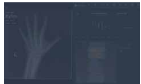
크레스콤의 골연령 판독 솔루션 MediAI-BA 예시

대표적인 기술로는 임상시험에서 높은 정확도를 확인 후 식약처 허가를 받아 몇 개월 만에 수십 개 병원에서 상용 서비스 중인 인공지능 골연령 판독 솔루션 MediAI-BA가 있으며 골절, 관절염, 척추염 등 골격계 분야에 특화된 다양한 기술을 개발하고 있습니다. 이외에도 뇌혈관 질환을 분석하는 인공지능 솔루션 개발을 진행하고 있습니다.