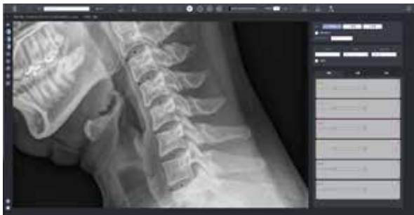
블랙올리브 Point 라벨링 예시

크레스콤에 최적화된 데이터 가공 프로젝트 가이드 및 일정을 수립하였고, 요구사항에 따라 고도화가 가능한 블랙올리브 데이터 가공 도구를 활용하여 고품질의 학습 데이터를 위한 가공 작업을 진행했습니다.