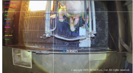
샘플 영상 데이터의 딥러닝 결과

세부적으로 수집한 영상데이터를 활용해 모든의 행동(기립, 앉음, 누움 등)을 분류함으로써 건강상태를 확인하고자 했습니다. 또한, 번식력과 관련하여 자돈의 품종, 분만 자세, 사산 유형(미라, 흑자, 체중미달 등) 등을 분류하고, 나아가 모든의 환경, 품종, 컨디션, 분만자세, 분만간격, 분만시간 등을 파악함으로써 모든의 분만 상황을 분석하고자 했습니다.